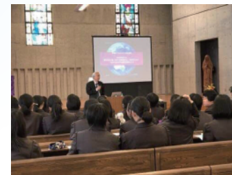
聖ドミニコ学園高等学校