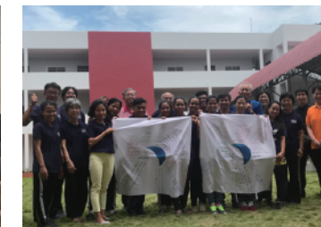
CIESF Leaders Academy