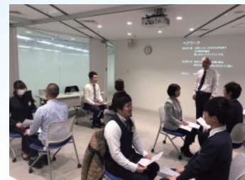
公益資本主義推進協議会 教育支援部会