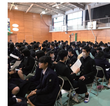
横浜市立浜中学校